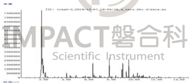
图 1 垃圾填埋场附近 VOCs 总离子流图

通过移动监测车对某垃圾填埋厂周边监测点进行在线连续监测，共检出 44 种 VOCs 成分，其中 42 种化合物进行定量，3 种定性硫化物。主要 VOCs 是丙烯，苯，甲苯等苯系物，具体结果请见图 1 和图 2。